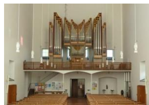
Heilig Geist, Emst