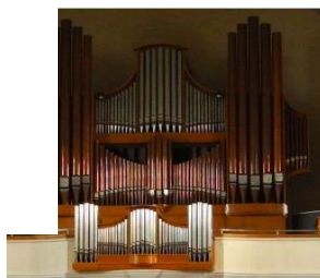
St. Elisabeth, Hagen