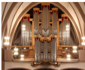
St. Bonifatius, Hohenlimburg