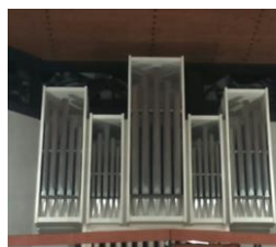
Heilig Kreuz, Halden